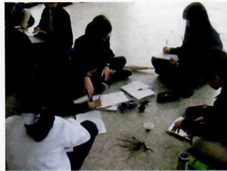
裸子植物組找到雄毬果超級興奮