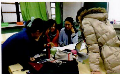
生物教師共同討論課程設計

本校生物教師利用每周共同不排課時間，集結討論課程設計，並將授課後的學生表現分享至網路社團中，帶起共備課程社群，並設計環境議題論證活動課程於全七年級生物課程中進行。