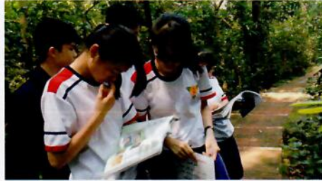
學生查閱課本定義尋找適合植物