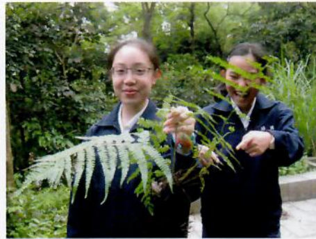
找到蕨類植物地下莖非常開心