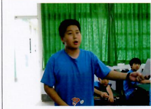
學生論證國光石化事件