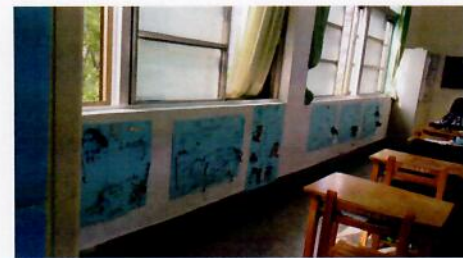
各小組製作海報展示於教室牆面