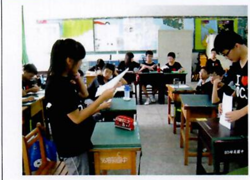
學生論證國光石化事件