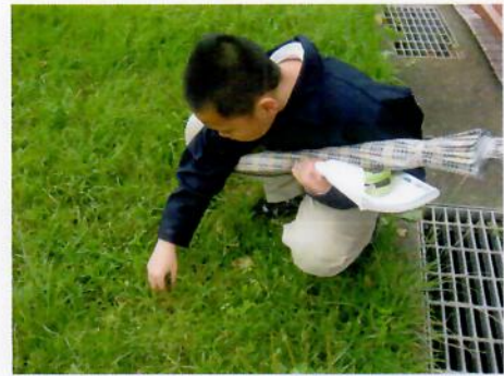
學生查閱課本定義尋找適合植物